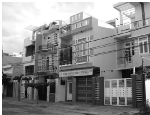
写真 1 ベトナム・ダナンの TUBE HOUSE