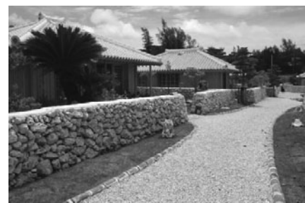
写真 3 建築研究所の技術指導によるかたあきの里