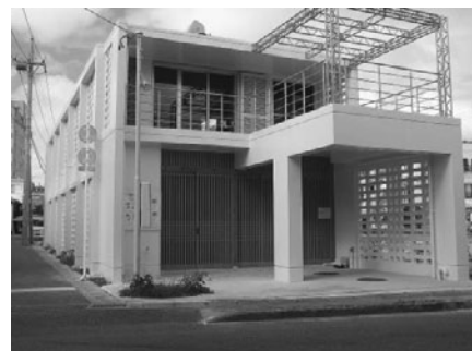
写真 2 建築研究所の技術指導によるエコハウス