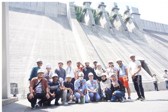
群馬研修旅行 ハッ場ダム (2023/8/29) 講師は国土交通省関東地方整備局職員