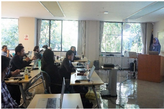
最終発表会 (2023/8/3) 8/3~4の2日間にわたっての開催