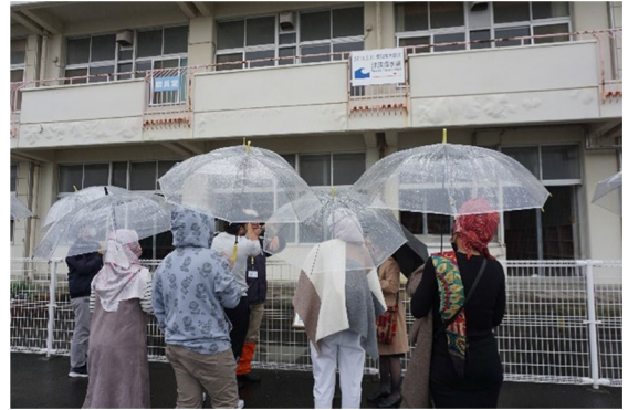
東北研修旅行 荒浜小学校 (2023/4/26) 東日本大震災の被災地見学