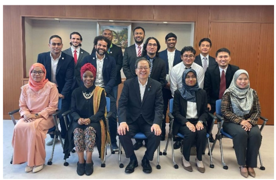
斉藤国土交通大臣表敬訪問 (2023/9/6)