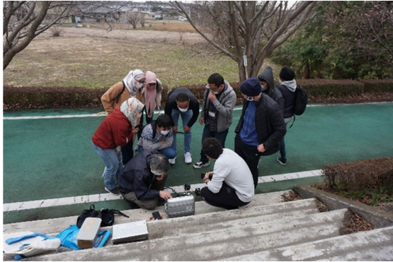
筑波山にて測定実習 (2023/3/6)