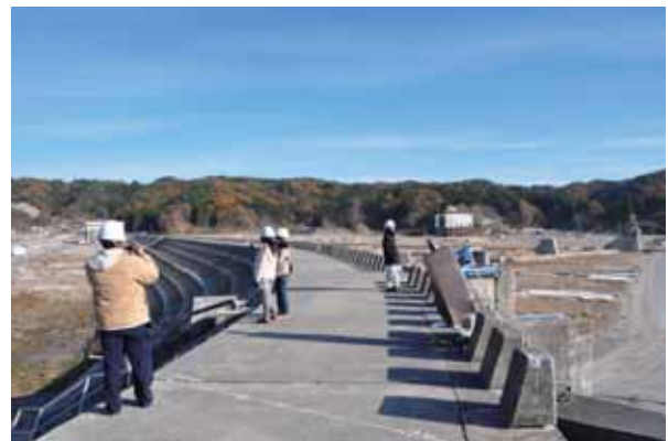
写真3 宮古市田老地区の大堤防。