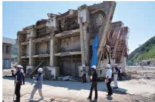
写真2 女川町の倒壊したビル。