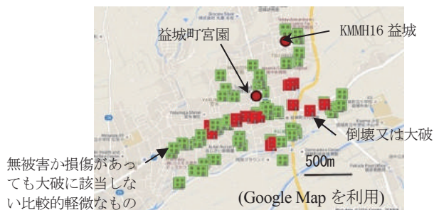
図1 益城町での調査建築物全96棟の位置

熊本地震の発災直後に、鉄骨造建築物の全般的な構造被害の把握と、被害原因や今後の詳細調査の必要性等について検討することを目的とした調査を実施した。この調査は、熊本地震の発災直後の4月20~21日の2日間で実施し、熊本市内