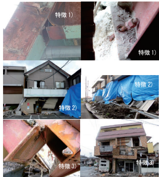
図2 益城町での被害状況の例