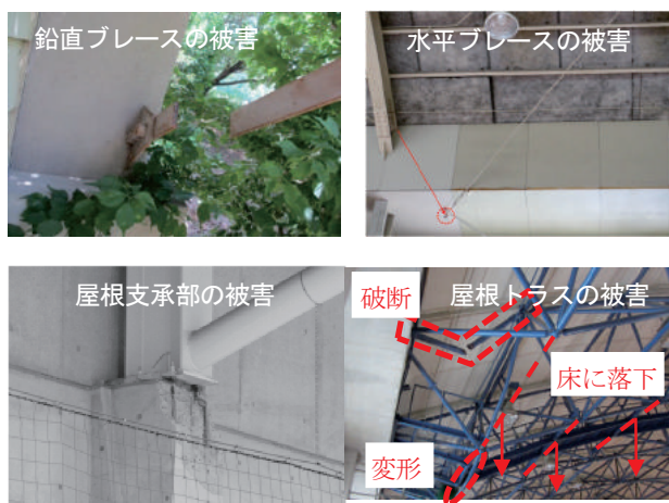
図 3 体育館の被害状況の例

図 4 に示すように、熊本市内の立体駐車場の構造的な被害として、溝形鋼ブレースの端部とブレース交差部のガセット