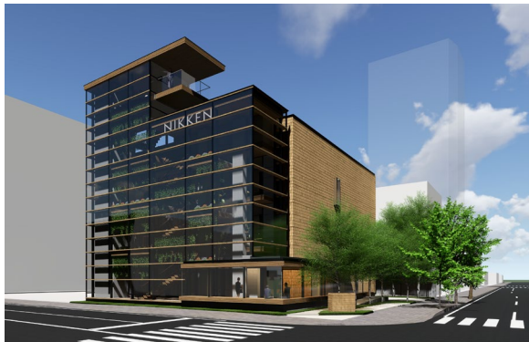
外観パース(南西面)